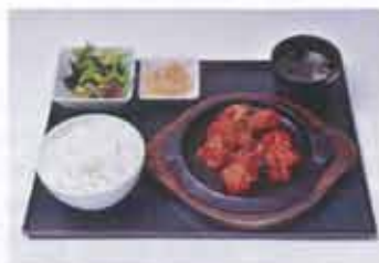
人気のぶるだっく定食